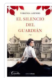
EL SILENCIO DEL GUARDIAN VIRGINIA ASENSIO