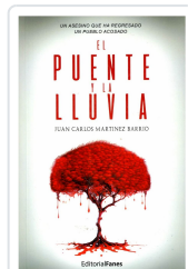
EL PUENTE Y LA LLUVIA JUAN CARLOS MARTÍNEZ BARRIO