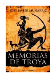
MEMORIAS DE TROYA JOSE JAVIER MUNARRIZ