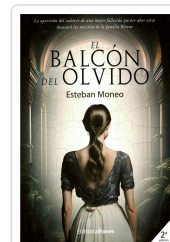
EL BALCÓN DEL OLVIDO ESTEBAN MONEO