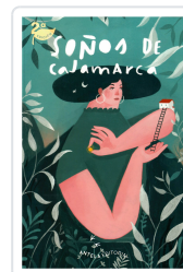
SOÑOS DE CAJAMARCA AA.VV