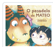
O PESADELO DE MATEO ESTEFANÍA PADULLÉS ESTÉVEZ