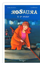
ROSAURA E O MAR ISABEL BLANCO