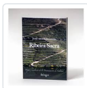
RIBEIRA SACRA JOSE MOURINO CUBA