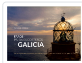
FAROS Y PAISAJES COSTEROS DE GALICIA RICARDO GROBAS