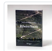
RIBEIRA SACRA JOSE MOURINO CUBA