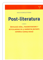
POST-LITERATURA ADOLFO RODRÍGUEZ POSADA