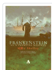
FRANKENSTEIN (TAPA DURA) MARY SHELLEY