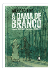
A DAMA DE BRANCO WILKIE COLLINS