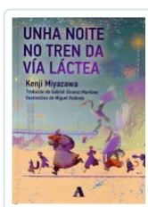
UNHA NOITE NO TREN DA VIA LACTEA KENJI MIYAZAWA