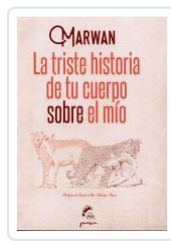
LA TRISTE HISTORIA DE TU CUERPO SOBRE EL MIO MARWAN