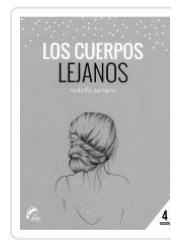
LOS CUERPOS LEJANOS RODOLFO SERRANO