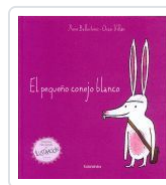
EL PEQUEÑO CONEJO BLANCO (19 EDICIÓN) XOSE BALLESTEROS;OSCAR VILLAN