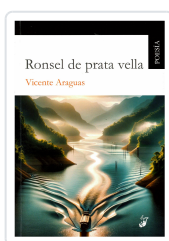
RONSEL DE PRATA VELLA VICENTE ARAGUAS