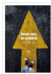
DONDE ESTES MI GENTILICIO RAFAEL GIL