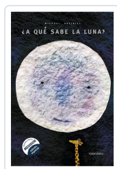
¿A QUE SABE LA LUNA? GREJNIEC, MICHAEL