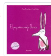
EL PEQUEÑO CONEJO BLANCO (19 EDICIÓN) XOSE BALLESTEROS;OSCAR VILLAN