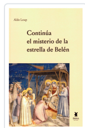
CONTINÚA EL MISTERIO DE LA ESTRELLA DE BELÉN ALDO LOUP