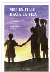
SIDI, UN VIAJE HACIA LA VIDA BRAXE, LINO