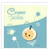
COSMO Y LA ESTRELLA PERDIDA MARCOS NEILA