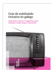
GUÍA DE SUBTITULADO INCLUSIVO EN GALEGO MARTÍNEZ LORENZO, MERCEDES