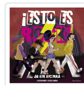
¡ESTO ES ROCK! JAVIER BECERRA