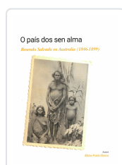
O PAÍS DOS SEN ALMA ALBINO PRADA BLANCO