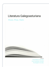
LITERATURA GALEGOASTURIANA XOÁN BABARRO;SUSO FERNÁNDEZ;RITA BUGALLO