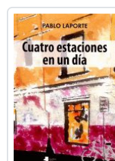
CUATRO ESTACIONES EN UN DÍA PABLO LAPORTE