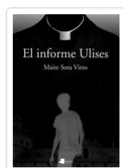
EL INFORME ULISES MAITE SOTA VIRTO