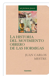
LA HISTORIA DEL MOVIMIENTO OBRERO DE LAS HORMIGAS JUAN CARLOS MESTRE