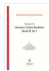
AVANÇOS EM LITERATURA E CULTURA BRASILEIRAS. SECULO XX. VOL.2 ASSOCIAÇÃO INTERNACIONAL DE LUSITANISTAS