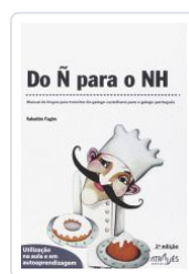
DO Ñ PARA O NH (2ªED) VALENTIM FAGIM