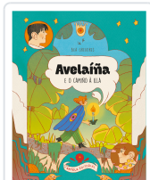
AVELAÑA E O CAMIÑO Á ILLA BEA GREGORES