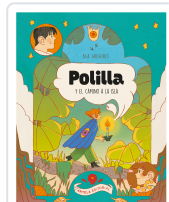
POLILLA Y EL CAMINO A LA ISLA BEA GREGORES