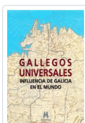
GALLEGOS UNIVERSALES VV.AA.: ALFONSO EIRE (COORD.)