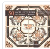
50 CAFES HISTÓRICOS DE ESPAÑA Y PORTUGAL FERNANDO FRANJO