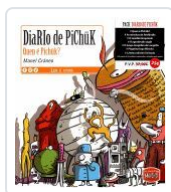
DIARIO DE PICHUK(PACK) MANEL CRANECO