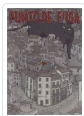
PUNTO DE FUGA MIGUEL CUBA