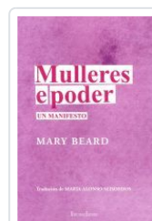
MULLERES E PODER MARY BEARD