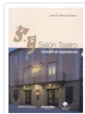
SALÓN TEATRO. CORAZÓN DO ESPECTÁCULO JESUS A. SANCHEZ GARCIA