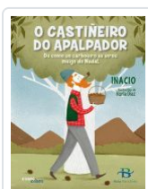
O CASTIÑEIRO DO APALPADOR.DE COMO UN CARBOEIRO SE VIROU MEI INACIO