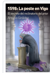
1598: LA PESTE EN VIGO ANTONIO GIRÁLDEZ