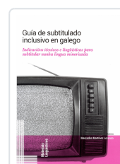
GUÍA DE SUBTITULADO INCLUSIVO EN GALEGO MARTÍNEZ LORENZO, MERCEDES