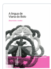
A LINGUA DE VIANA DO BOLO CONCEPCIÓN ÁLVAREZ POUSA