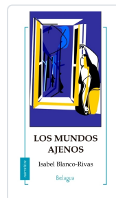
LOS MUNDOS AJENOS ISABEL BLANCO-RIVAS