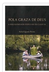
POLA GRAZA DE DEUS A RELIXIOSIDADE POPULAR EN GALICIA RAFAEL QUINTIA PEREIRA