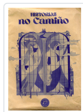
HISTORIAS NO CAMIÑO (BOLSA LIBRO+ AGASALLOS) AA.VV.