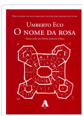
O NOME DA ROSA ECO, UMBERTO