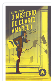
O MISTERIO DO CUARTO AMARELO LEROUX, GASTON