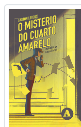
O MISTERIO DO CUARTO AMARELO LEROUX, GASTON