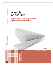
A ESCOLA AO AIRE LIBRE ROBERTO SILVA PINEIRO