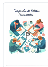
COMPENDIO DE RELATOS MANUSCRITOS VV.AA.