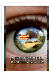
A IRMANDADE DA BANDEIRA BRANCA ANXO MUÍÑOS