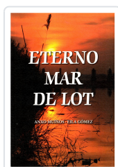
ETERNO MAR DE LOT ANXO MUÍÑOS; EILA GÓMEZ