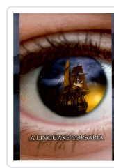
A LINGUAXE CORSARIA ANXO MUÍÑOS