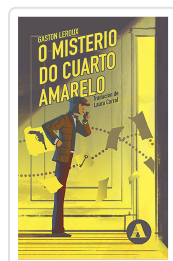
O MISTERIO DO CUARTO AMARELO LEROUX, GASTON