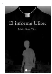
EL INFORME ULISES MAITE SOTA VIRTO