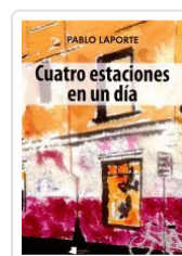
CUATRO ESTACIONES EN UN DIA PABLO LAPORTE