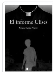
EL INFORME ULISES MAITE SOTA VIRTO