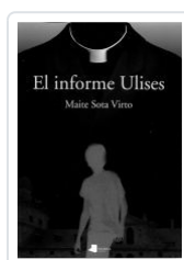
EL INFORME ULISES MAITE SOTA VIRTO