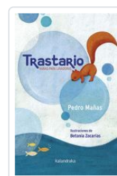
TRASTARIO. NANAS PARA LAVADORAS PEDRO MAÑAS; BETANIA ZACARIAS (ILU.)