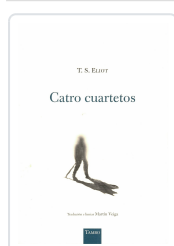
CATRO CUARTETOS T.S. ELIOT