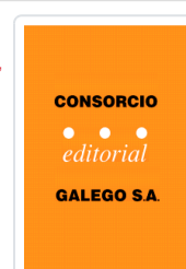
ALÉN DA FRONTEIRA VV.AA.