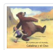
CATALINA Y EL OSO, SIN RUMBO POR EL MUNDO PIEPER, CHRISTIANE