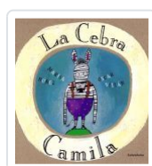
LA CEBRA CAMILA(26ª EDICION) MARISA NUNEZ;OSCAR VILLAN(ILU.)