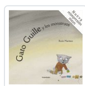
GATO GUILLE Y LOS MONSTRUOS MARTINEZ PEREZ, ROCIO