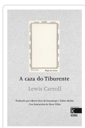
A CAZA DO TIBURENTE LEWIS CARROLL