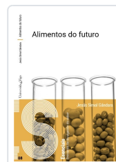
ALIMENTOS DO FUTURO JESÚS SIMAL GÁNDARA