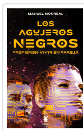
LOS AGUJEROS NEGROS PREFIEREN VIVIR EN PAREJA MANUEL MONREAL