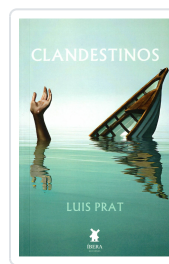
CLANDESTINOS LUIS PRAT