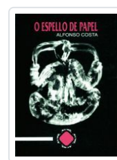
O ESPELLO DE PAPEL ALFONSO COSTA