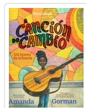
A CANCIÓN DO CAMBIO AMANDA GORMAN