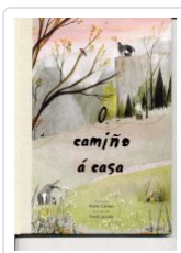
O CAMIÑO A CASA KATIE COTTON; SARAH JACOBY (ILU.)