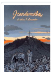
GRANDARROIBA 2º EDICION CRISTIAN F. CARUNCHO