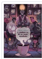
O SALON DE TE DO OSO MALAIO DAVID RUBIN