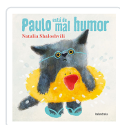
PAULO ESTÁ DE MAL HUMOR (Galego) NATALIA SHALOSHVILI