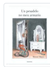
UN PESADELO NO MEU ARMARIO MAYER, MERCER